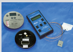
紫外線量測表 EIT UV Meter