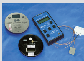
紫外線量測表 EIT UV Meter